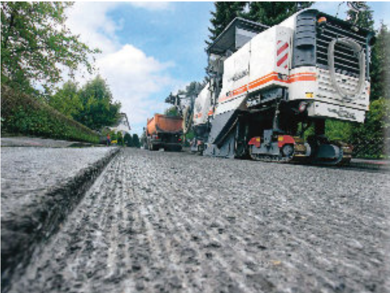
Optimale Oberflächenstruktur für die Deckschichtsanierung

Die Fräsgeschwindigkeit bestimmt neben dem Linienabstand und der Fräswalzendrehzahl die Oberflächenstruktur. Dabei gilt: je höher die Fräsgeschwindigkeit, desto rauer ist die Oberfläche. So kann beispielsweise ein und dieselbe Fräswalze bei konstanter Fräswalzendrehzahl, aber unterschiedlichen Fräsgeschwindigkeiten eine Oberflächentextur mit unterschiedlichen Fräsbildern erzeugen.